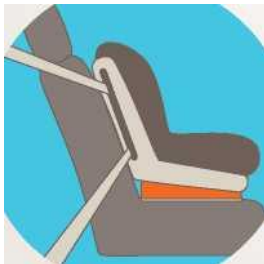
Лицом по ходу движения

Самое безопасное место для установки детского кресла в автомобиле - среднее место на заднем сиденье. Самое небезопасное - переднее пассажирское сиденье и на него автокресло ставится в крайнем случае, при обязательно отключенной подушке безопасности.